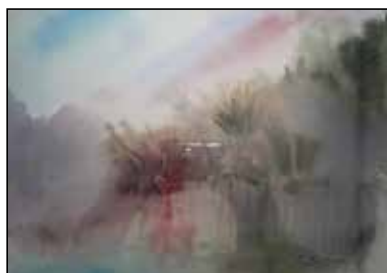
33. FOUAD SNITER "Impresija jutra", akvarel