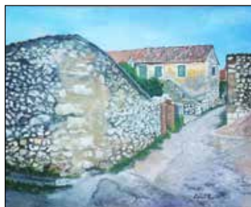
26. ROZARIJA PEROVIĆ LUČIĆ "Vukićeva ulica", ulje - platno