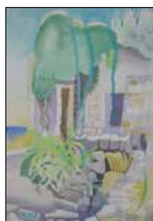
20. JANEZ MILKOVIČ Krajolik, akvarel