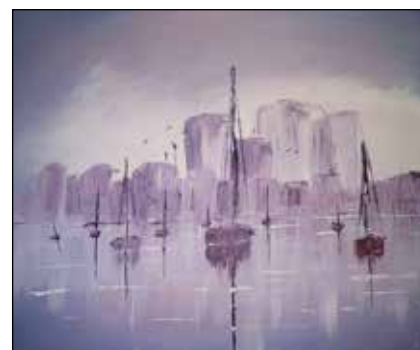
6. VENERA DELIJA "Tiha Marina", ulje - platno