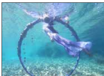
23. NIKA PETROVIĆ "Keramički portal", foto. u boji