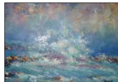
35. MILAN STUNJA "Nevera", ulje - platno