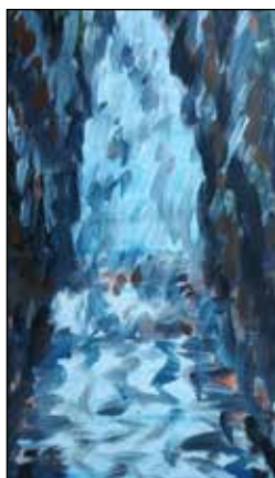
2. MILAN CIGLAR "Slap", akril - platno