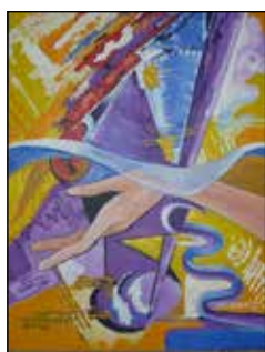
18. MARGITA MEGGYERI ZUBČIĆ Kompozicija, ulje - platno