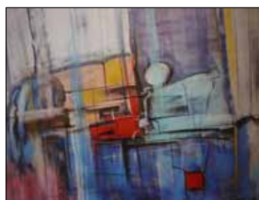
36. MARIO TOMAS Kompozicija, suhi pastel