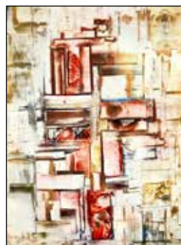
9. MARIJA JOZA Kompozicija, enkaustika