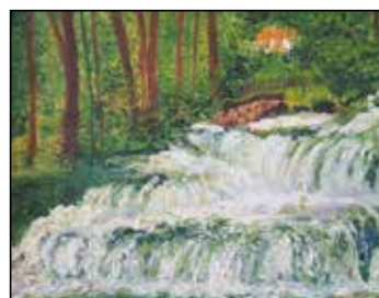
34. SVJETLANA TANJA SORIĆ "Slapovi", ulje - platno