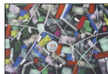
40. STIPE ZRILIĆ Kompozicija, suhi - pastel