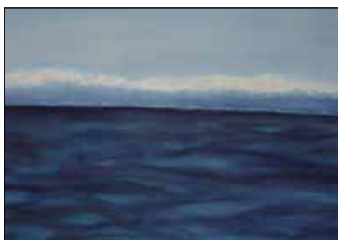
5. JAMINKA ČIŠIĆ "Na moru", akvarel