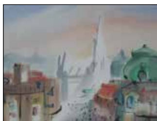
29. MILORAD RUPČIĆ "Vienna - Beč", akvarel