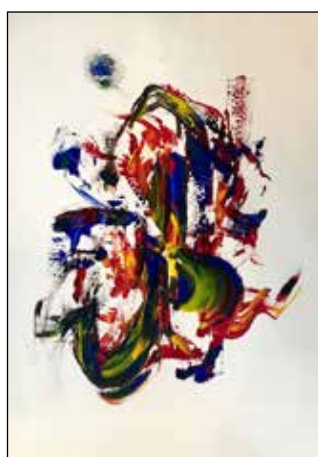
41. ZORAN ZEKANOVIĆ Apstrakcija, mix media