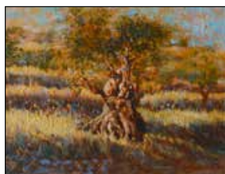
30. NEBOJŠA RUŽIĆ VARDA "Maslina iz Arkadije", ulje - platno