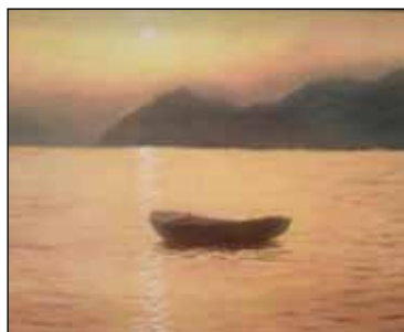
27. ANTE ROGIĆ "Suton", ulje - platno