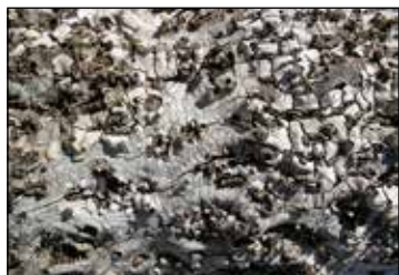
1. BRANKO ANTUNOVIĆ Foto - kompozicija u boji