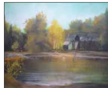
28. BOŽO RUPČIĆ "Krajolik uz rijeku", suhi pastel