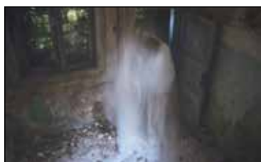
22. ANDREJA PEKLAJ Foto - kompozicija, print - platno