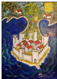
14. ŽELJKO KOLIĆ Veduta, ulje - platno