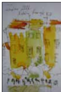
16. NATALIA KRUNGLE Gradski trg, akvarel