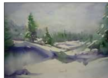
24. ROMAN PLANKO "Zima", akvarel