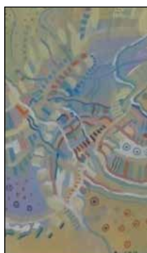
7. MIRKO DRAGOVIĆ Kompozicija, ulje - platno