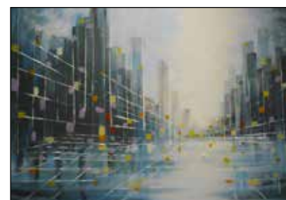
42. BORIS ŽUŽA "Urbana scena", akril platno