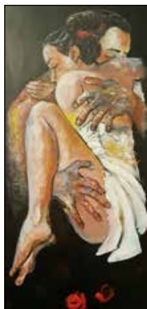
4. IVA ČAČIĆ "Zagralaj", akril - platno