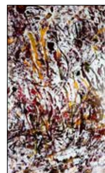
10. ANĐELO JURLINA Kompozicija, komb. tehnika