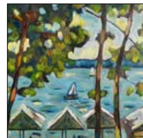
21. NEVEN OTAVIJEVIĆ "Kolovare", ulje - platno