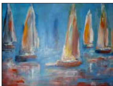
19. MIRJANA MODRUŠAN "Jedra", ulje - platno