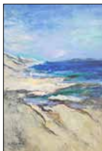
25. SILVIA PEROVIĆ "Kornati", ulje - platno