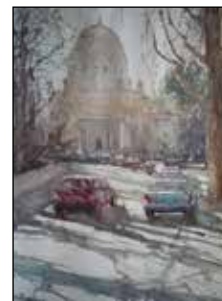
17. TOMISLAV KOŠTA Veduta Zadra, akvarel