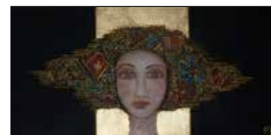
13. MIROSLAVA KOS Portret djevojke, komb. tehnika