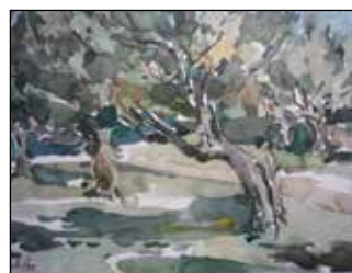
31. SELE SELAKOVIĆ "Masline", akvarel