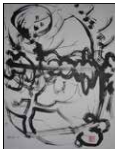
15. ALFRED FREDY KRUPA Kompozicija, crni - tuš