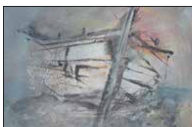
12. BISERKA KOMAC Kompozicija, komb. tehnika