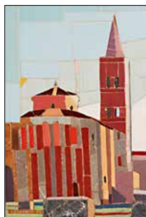
37. JADRAN ZELENČIĆ "Sv. Donat", mozaik